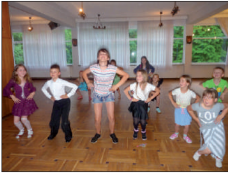
Trening taneczny na obozie.