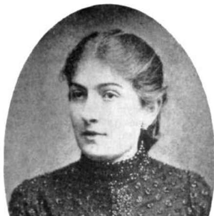
Stefania Sempołowska - fot. Wikipedia

Mijający okres niemal 100-letniej działalności na rzecz najlepiej pojętego interesu dziecka przez działaczy, sympatyków, ludzi nauki, medycyny, pedagogów skupionych wokół Towarzystwa Przyjaciół Dzieci łączyło jedno – dobro dziecka i jego szczęśliwe dzieciństwo.