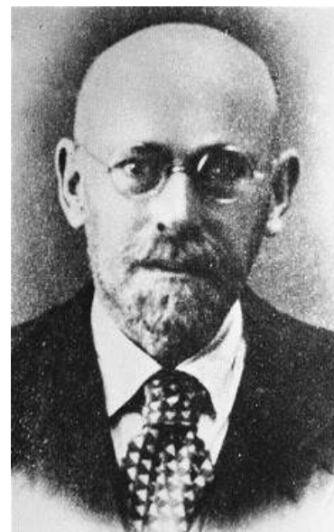
Janusz Korczak

Działania te spowodowały, że posłowie wnosili pod obrady sejmowe sprawy zdrowia, opieki jak również wychowania dzieci.