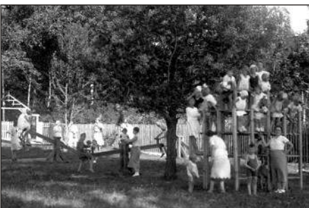
Ogród Jordanowski

Zaczęły się jednak rodzić pytania - jak temu zaradzić. Początkowo działania na rzecz dziecka miały charakter filantropijny i dobroczynny, propagowany zwłaszcza w środowisku lekarskim. Szybko dostrzeżono, że efekty tych działań są niezadowolające. Zrozumiano, że tylko powołanie na terenach polskich stowarzyszenia doprowadzi do wymuszenia na władzy podjęcia konkretnych działań chroniących dobro dziecka.